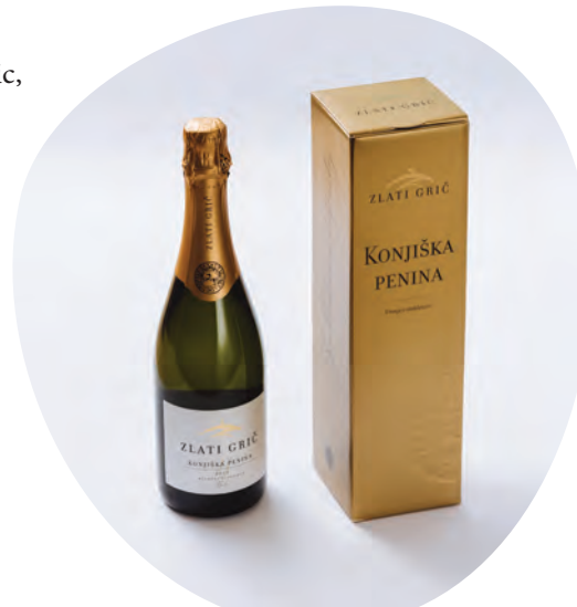
Konjiška penina Zlatega griča