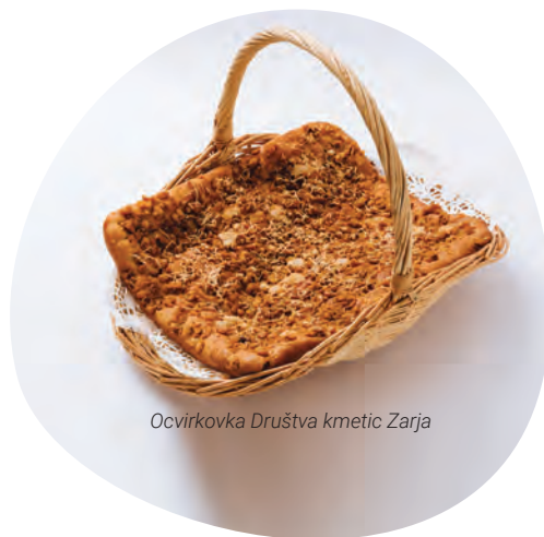
Ocvirkovka Društva kmetic Zarja