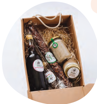
Paket mesnin Turistične kmetije Arbajter