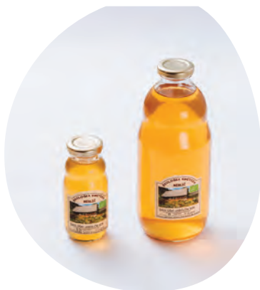
Jabolčni sok Ekološke kmetije Meglič