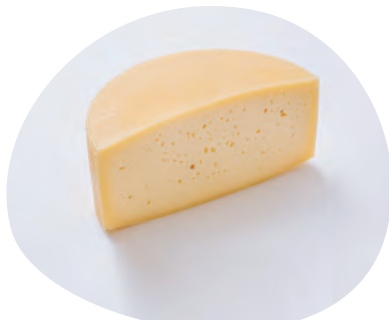
Sir s Kmetije Lamperček-Obrul