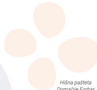
Hišna pašteta Domačije Forbar