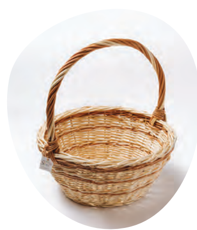
Pletena košara s Pletarstva in žganjekuhe Kalšek-Podkrajšek