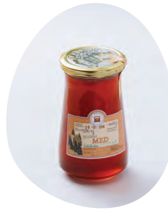
Domači med Čebelarstva Kamenik