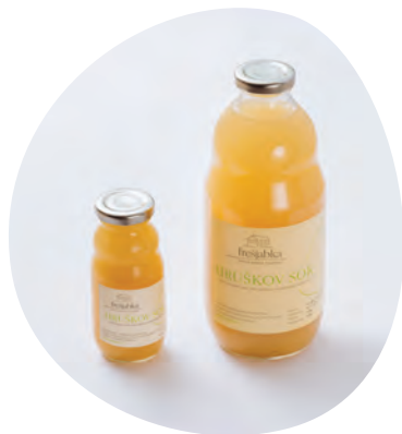
Frešerjev naravni hruškov sok