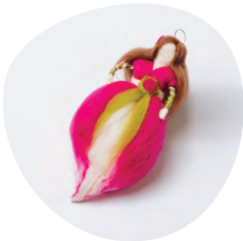
Ročno izdelana pohorska vila rojenica Mojce Potnik Šonc