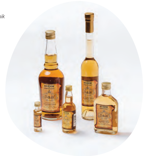
Liker Kuzjok Žganjekuha Vahter