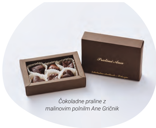
Čokoladne praline z malinovim polnilom Ane Gričnik